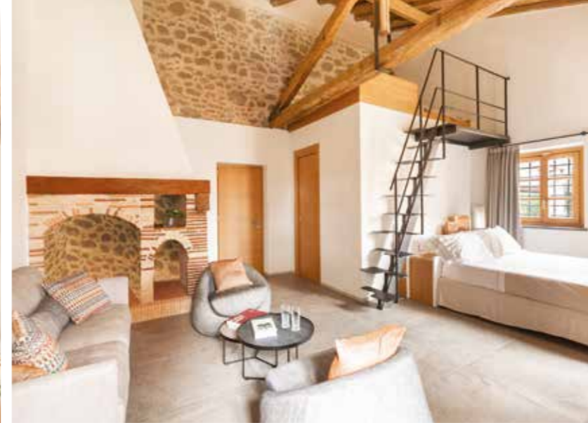
A SINISTRA, IL LIVING PRINCIPALE E IN BASSO ALCUNI DETTAGLI E LA SALA RICEVIMENTI. IN QUESTA PAGINA, UNA STANZA E UNA CUCINA ANNESSA. IN BASSO, LA SCALA DI UN'ALTRA STANZA E LA RECEPTION DEL RESORT. LEFT: THE MAIN LIVING ROOM. BELOW: SOME CLOSE-UPS AND THE FUNCTION ROOM. ON THIS PAGE: A BEDROOM AND ADJOINING KITCHEN. BELOW: THE STAIRS OF ANOTHER BEDROOM AND THE RESORT'S RECEPTION.